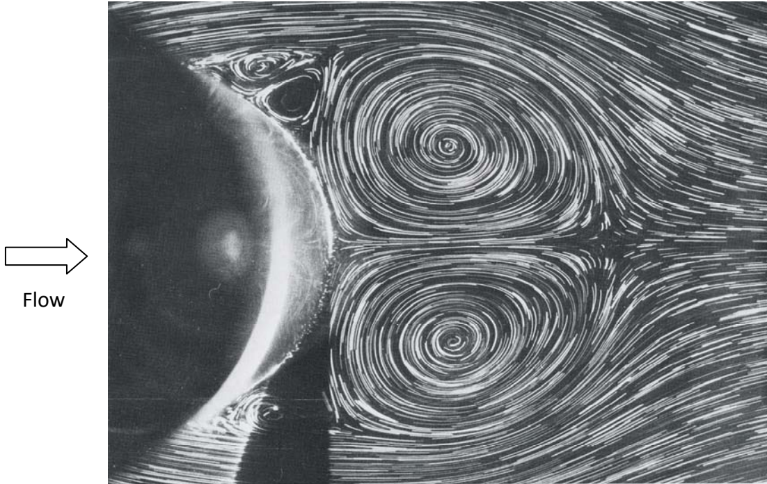
(a) 水槽実験, Re=3,000 , t^*=2.5

Journal of Fluid Mechanics, Vol.101, part 3