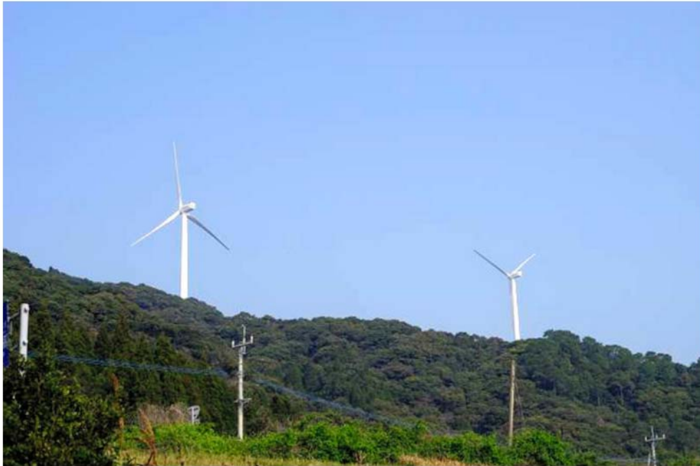
今年3月から発電を開始した東芝製の風車＝鹿児島県長島町