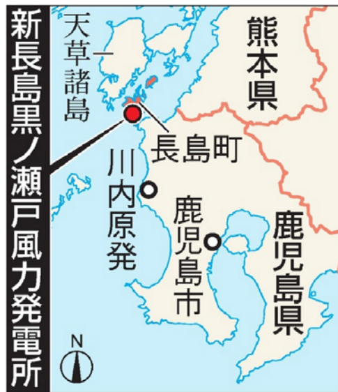
鹿児島県長島町の地図